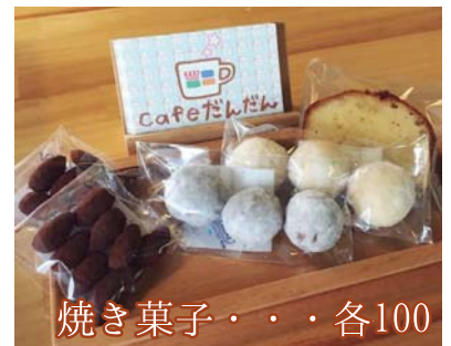
焼き菓子・・・各100