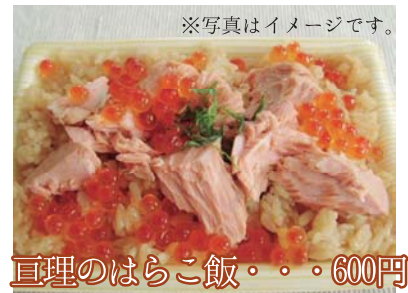
亘理のはらこ飯・・・600円