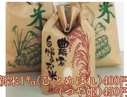
新米1kg(ひとめぼれ)400円 (つや姫)450円